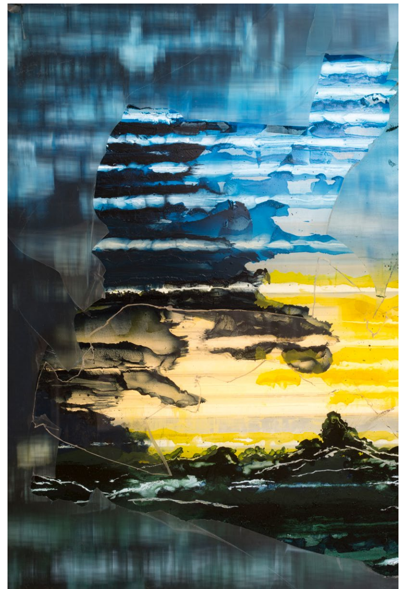
Een van de kunstwerken van Vissers Vorstenbosch in het kantoor van het K.F. Hein Fonds

hoe het er gekomen is: "Tijdens een korte werkperiode bij Casco ben ik uitgenodigd om te komen spelen met het kopieerapparaat en om elkaar beter te leren kennen. Hieruit ontstonden een reeks publicaties, die zich weer vertaalden naar deze wandcollage." Hij wijst op de collage van kopietjes, oude tekeningen en schilderijen in het atelier. "Het